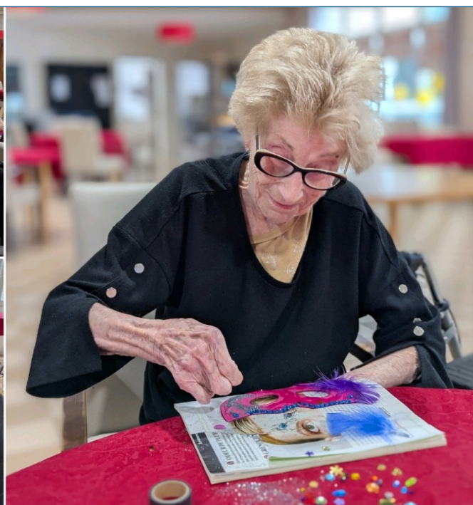
Vendredi 21 février préparation des masques de carnaval avec le Pasa