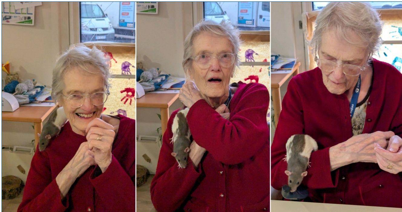
Médiation animale février 2025 . Rencontre avec une rate ...