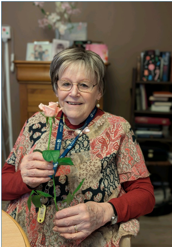
Joyeuse St Valentin