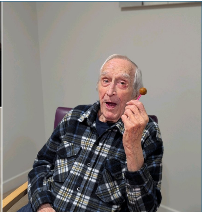
Repas festif en soirée du 21 février.