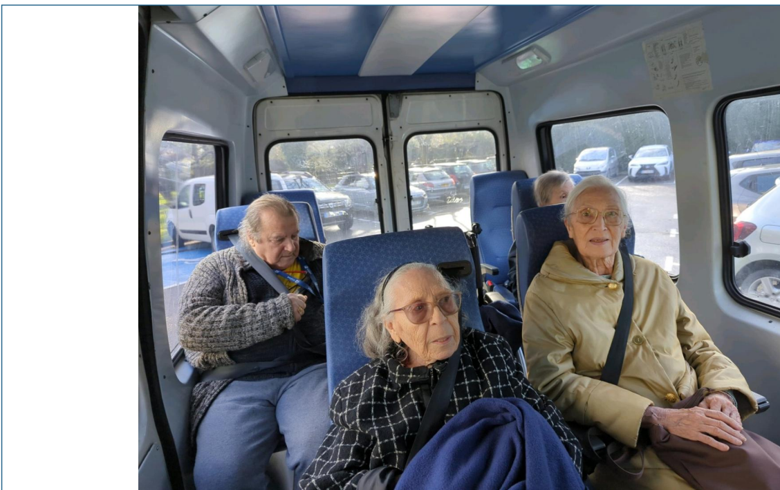
En route pour le marché d Orange