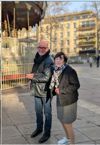
Sortie à l'opéra d'Avignon