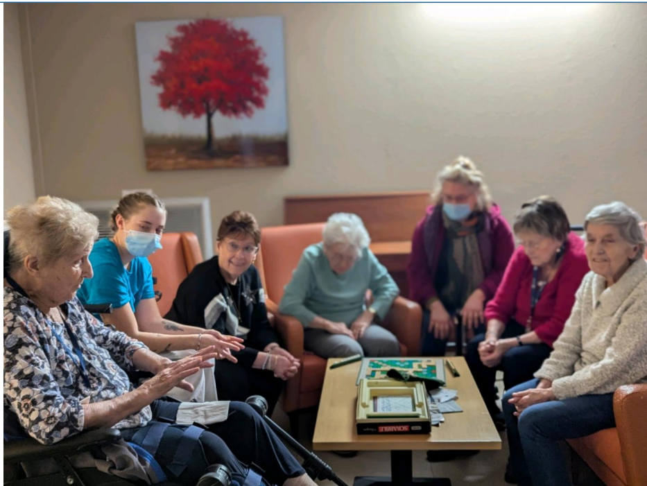
Petit temps de jeu