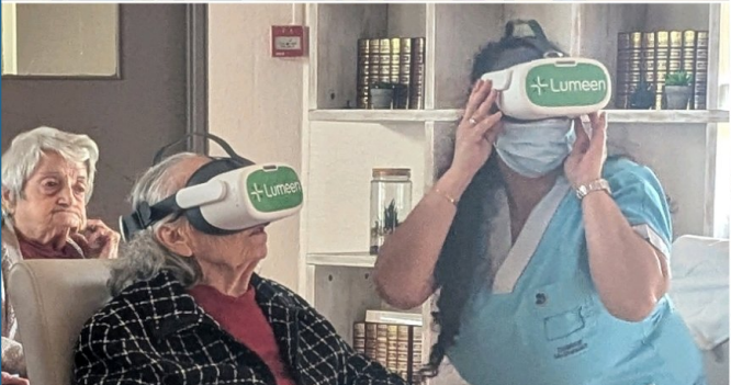
Lumeen : outil au service du bien être des résidents et des salariés