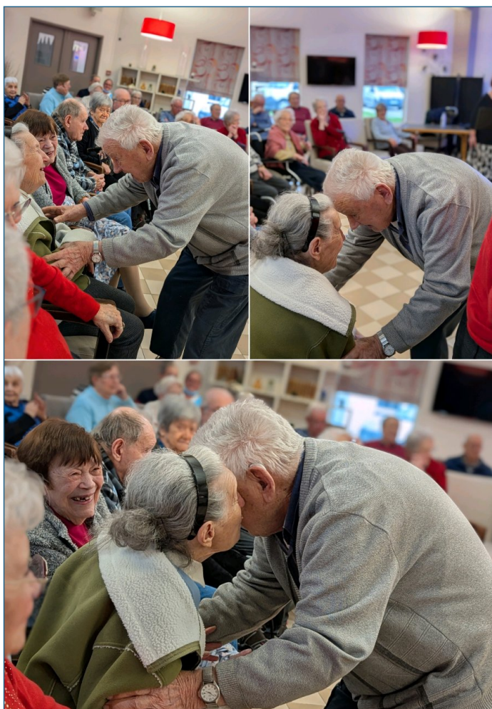
Beau moment de retrouvailles