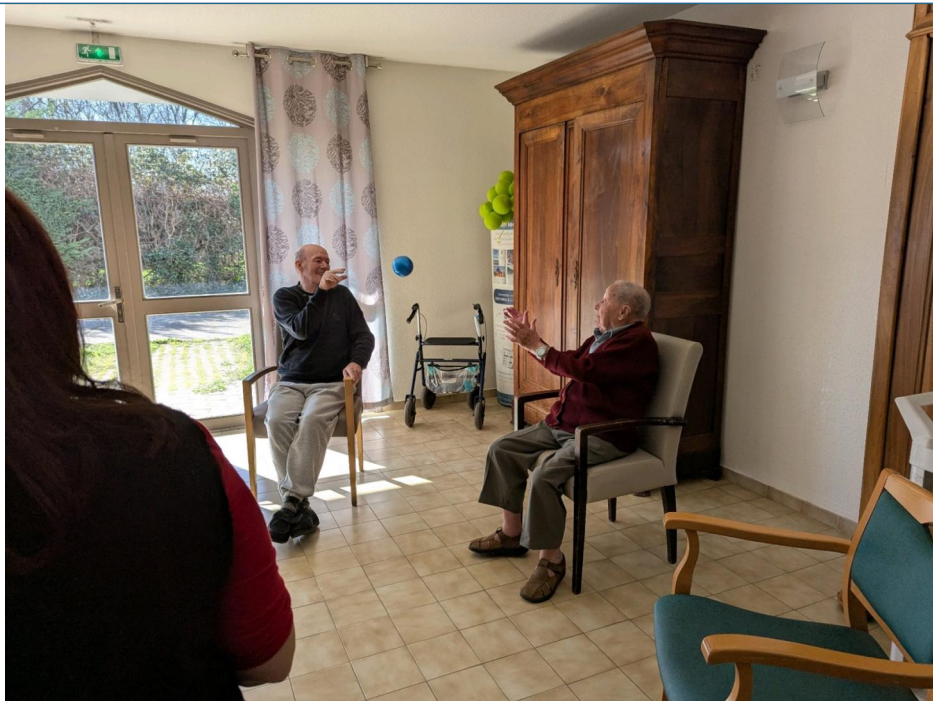
Jeux de balle