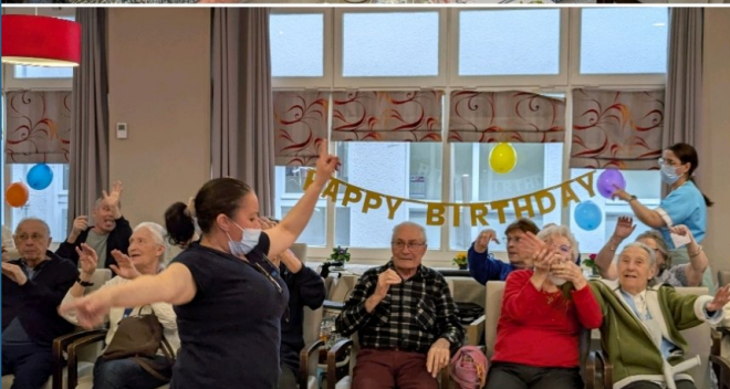
Nous fêtons les anniversaires du mois de février.