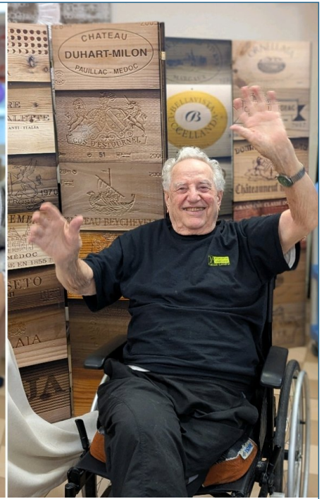
La joie c est contagieux