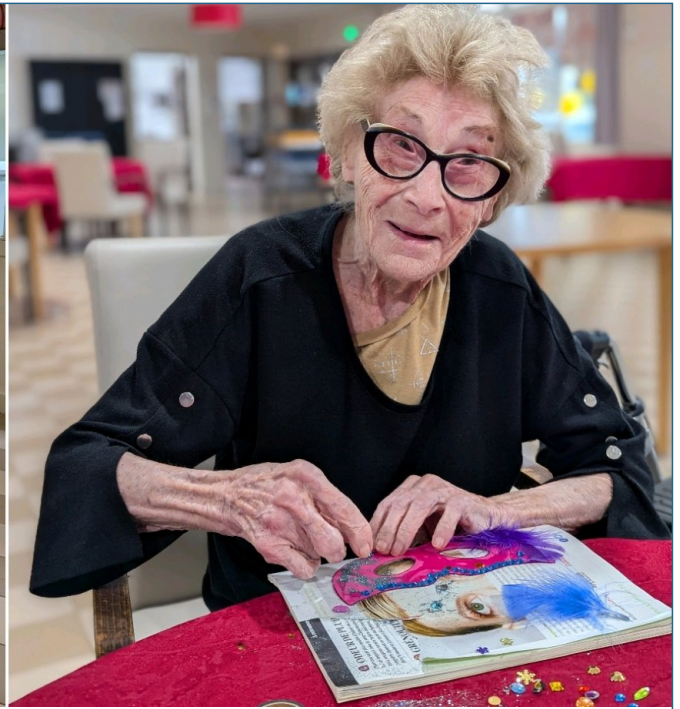
Les résidents ont passé un bon moment mais il est temps de ranger avec soin toutes ces belles productions