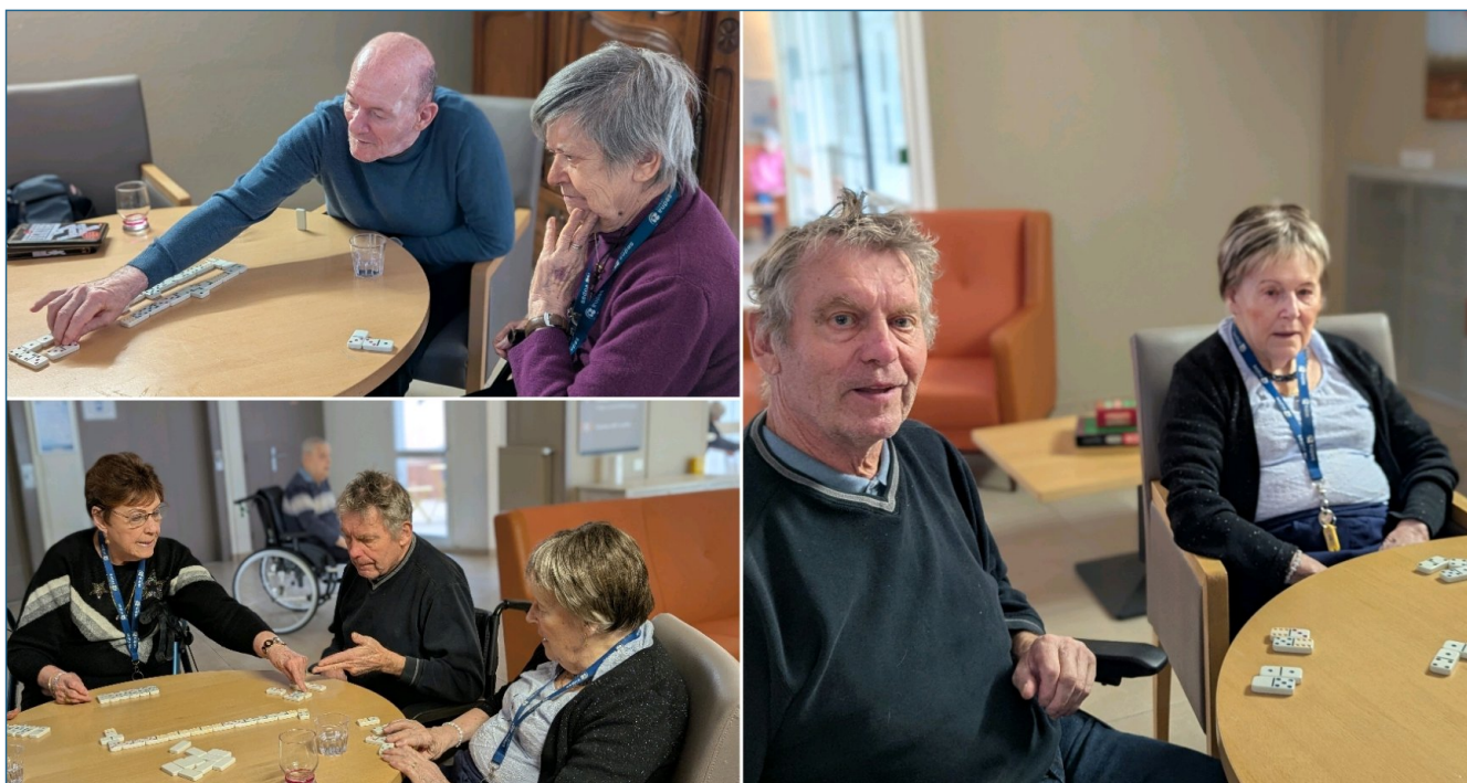
Jeux de société : les dominos étaient à l'honneur mardi 18 février 2025