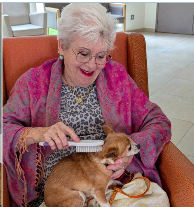
Petit temps de plaisir partagé