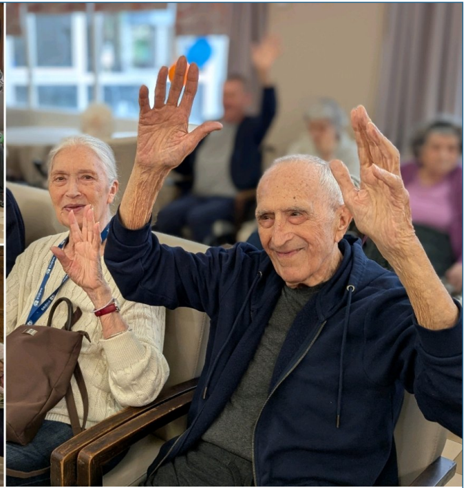
Faire la fête c'est bon pour le moral