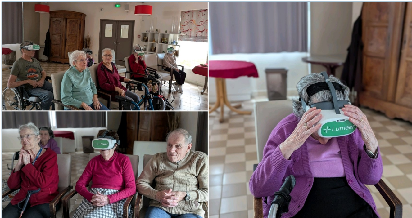
L Afrique et ses animaux sauvages étaient à l honneur pour ces voyages virtuels que nous avons fait ce mercredi 19 février 2025