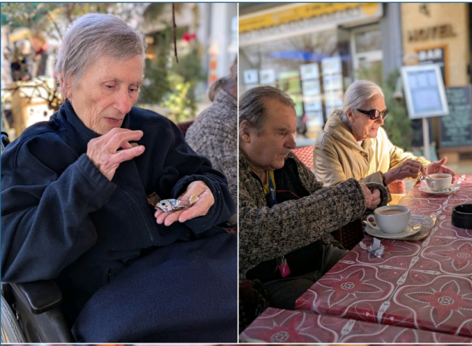
Sortie au marché : petite pause chocolat chaud