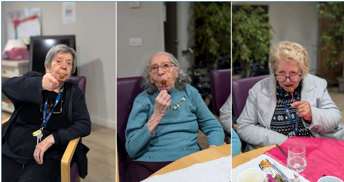
Sucette traditionnelle de fin de soirée