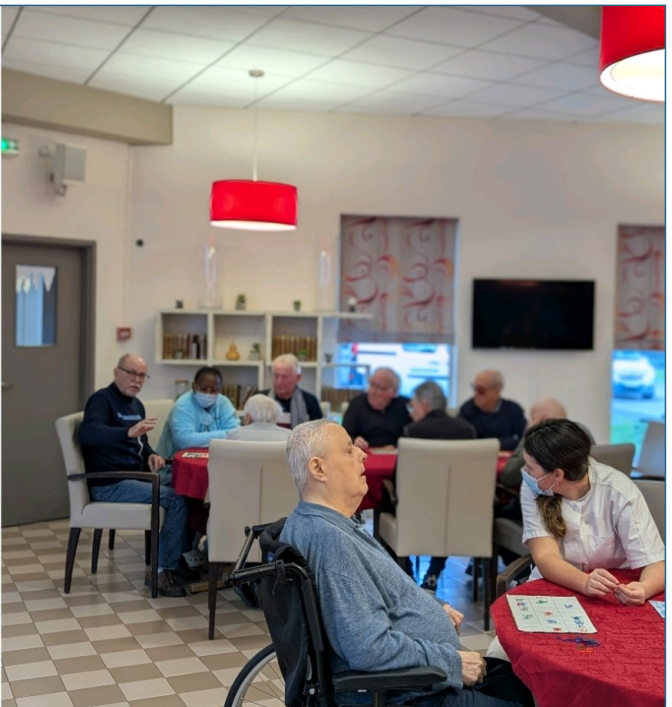
Loto de la St Valentin