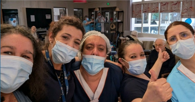
Beaux moments d'amitié et de complicité durant la fête des anniversaires.