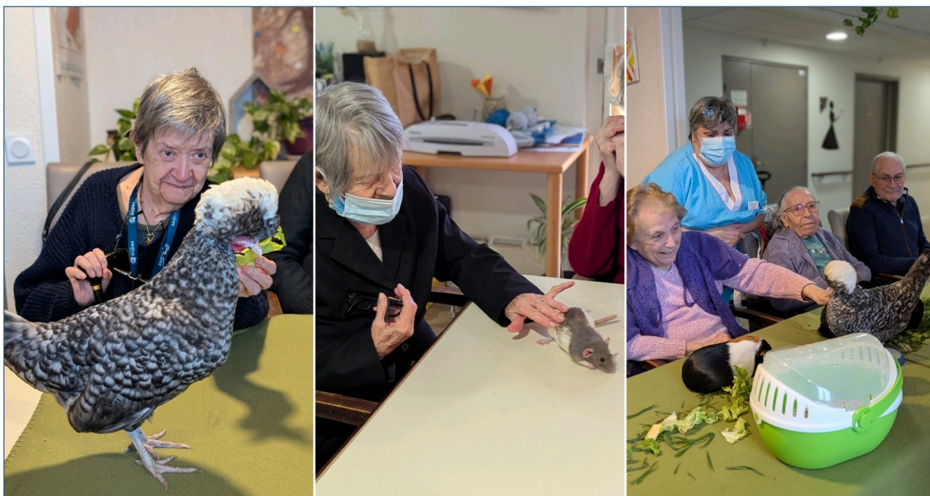
Médiation animale février 2025