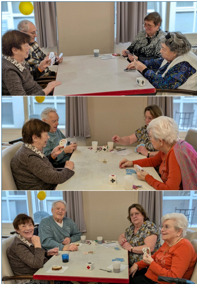
Les joueurs de belote se sont donnés rendez-vous.