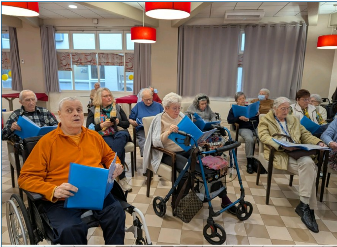
Découverte de nouveaux chants pour la chorale