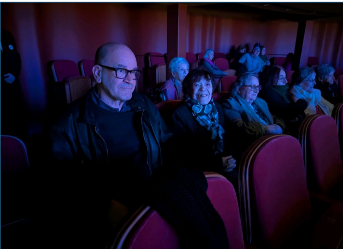
Sortie à l'opéra : Wagner était à l'honneur