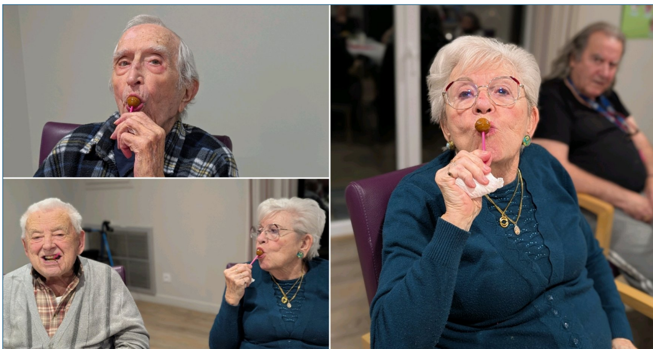
Il y en avait pour tous les gourmands