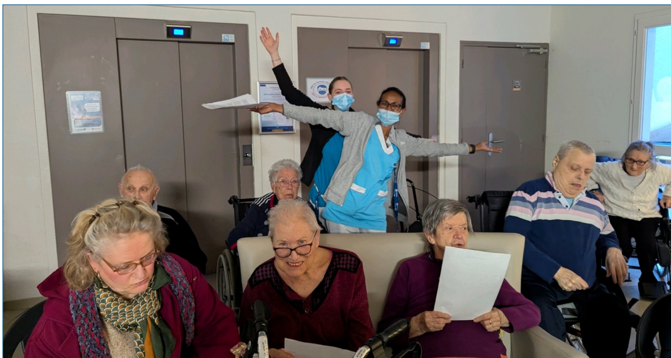
Les soignantes chantent "Monsieur Carnaval" avec les résidents