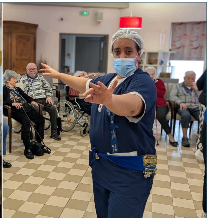
L'ambiance était contagieuse