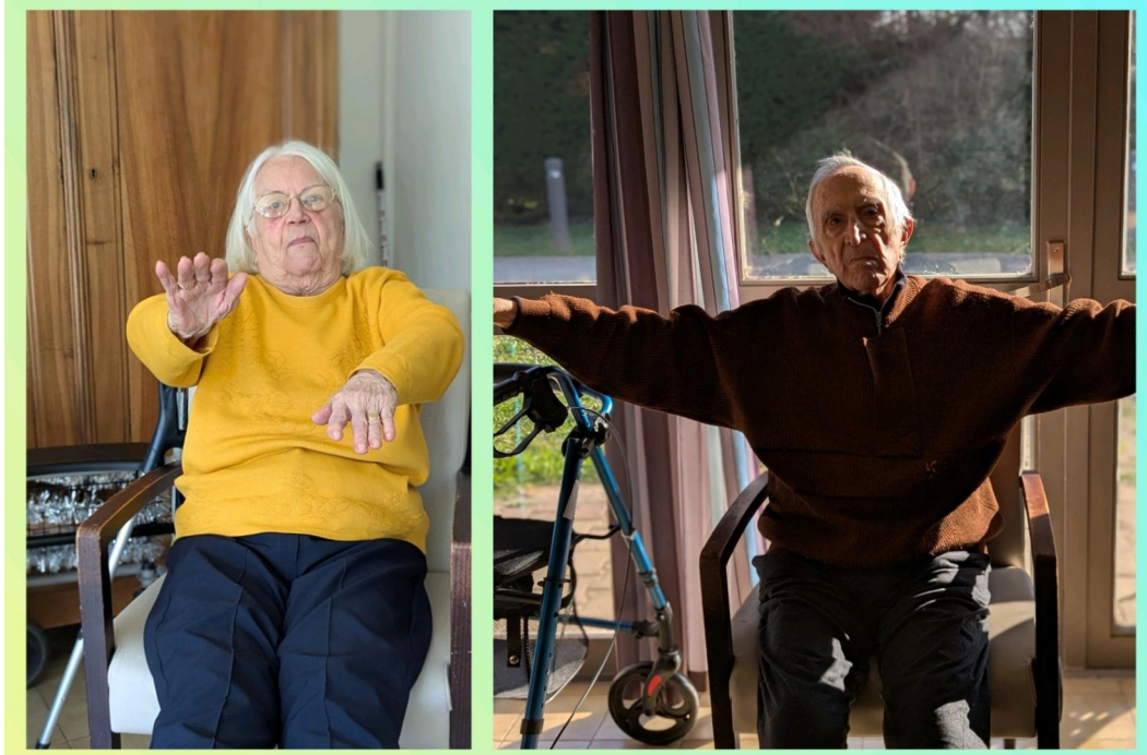
Atelier Gym douce